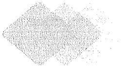
Tabla 1. Especificaciones de Calidad de la CT Carbón II